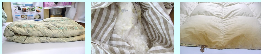
□ ボリュームがなくなった □ 中の羽毛が出てきた □ 襟元が汚れてきた