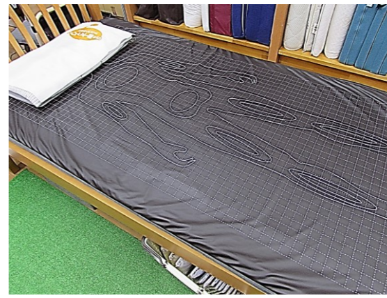
体圧測定器で体への圧力を測定いたします (仰向と横向の体圧、左右のバランスや腰の隙間)