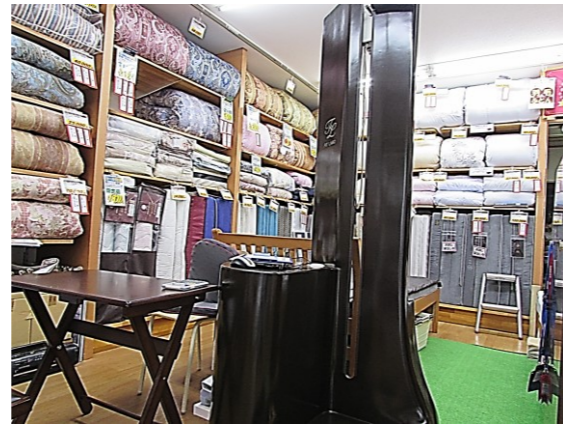
立位測定器で体の側面と背面を測定いたします (リラックス状態で仰向き寝と横向寝の凹凸を測定)